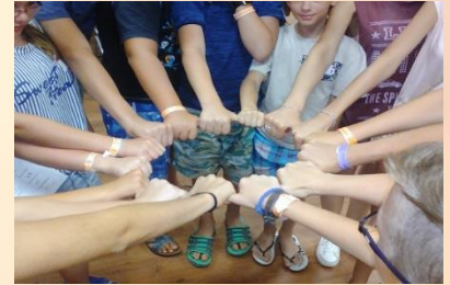
„BOLDGABB CSALÁDOKÉRT” CSÉN program

„Szívügyem a gyermekek, fiatalok házasságra, boldog családi életre való felkészülése, a családok harmonikus életének segítése.”