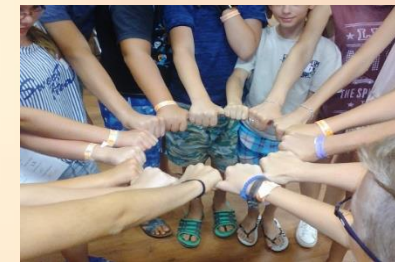
„BOLDGABB CSALÁDOKÉRT” CSÉN program