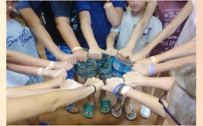
„BOLDOGABB CSALÁDOKÉRT” CSÉN program

Életünk a család! megkapja a jogot a programnév használatára és önálló CSÉN módszertani bemutatók szervezésére.