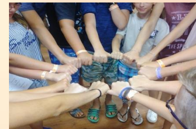
„BOLDOGABB CSALÁDOKÉRT” CSÉN program