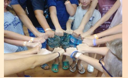
„BOLDOGABB CSALÁDOKÉRT” CSÉN program