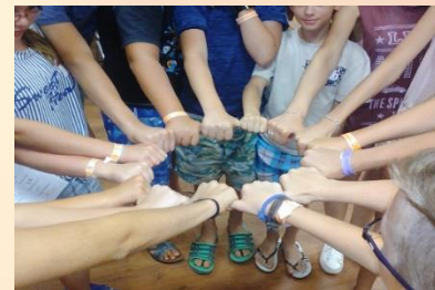
„BOLDOGABB CSALÁDOKÉRT” CSÉN program

Úgy kísérelje a fiatalokat kisiskolás kortól a serdülőkor viharain át személyiségük megszilárdulásáig, hogy