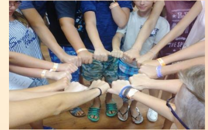
„BOLDOGABB CSALÁDOKÉRT” CSÉN program